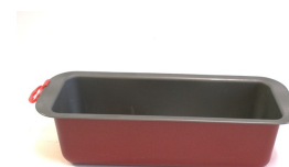
Un moule à cake