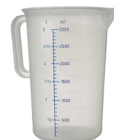
Un bec doseur